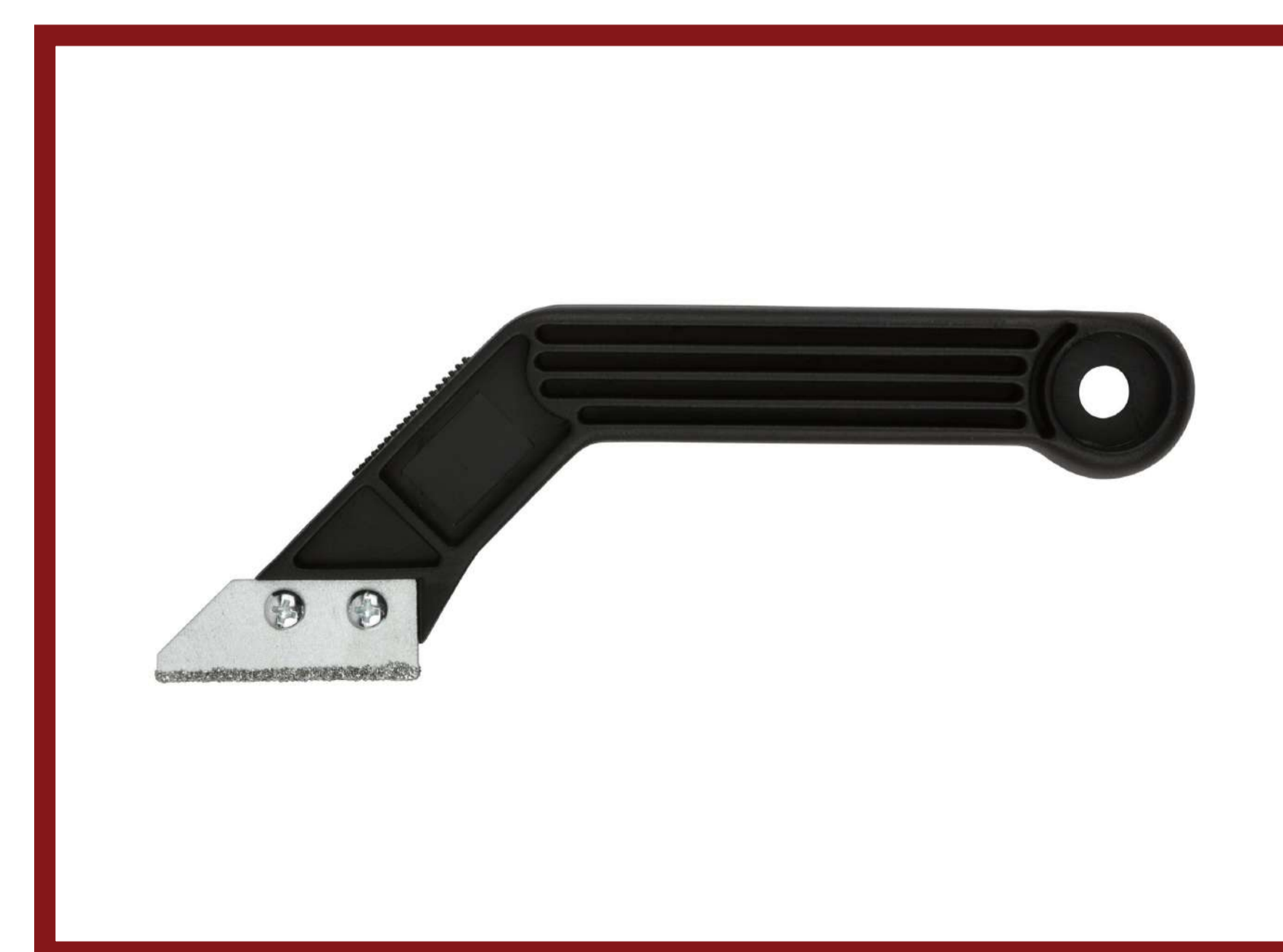
Инструмент для расшивки швов