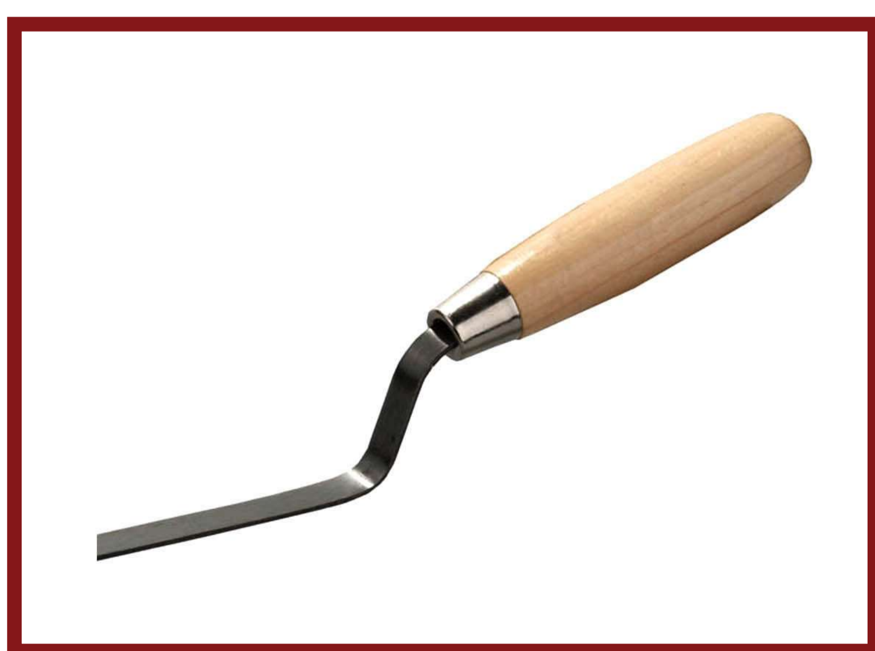
Инструмент для расшивки швов

Не разрешается проводить работы со смесью при температуре воздуха и камня ниже +5°C для летней смеси и ниже -10°C для зимней.